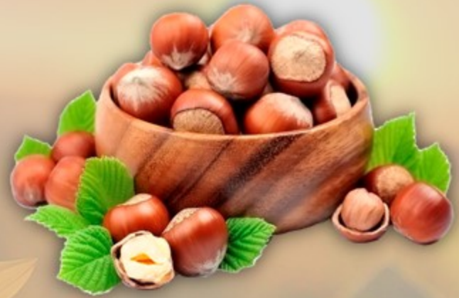
ФУНДУК В СКОРЛУПЕ