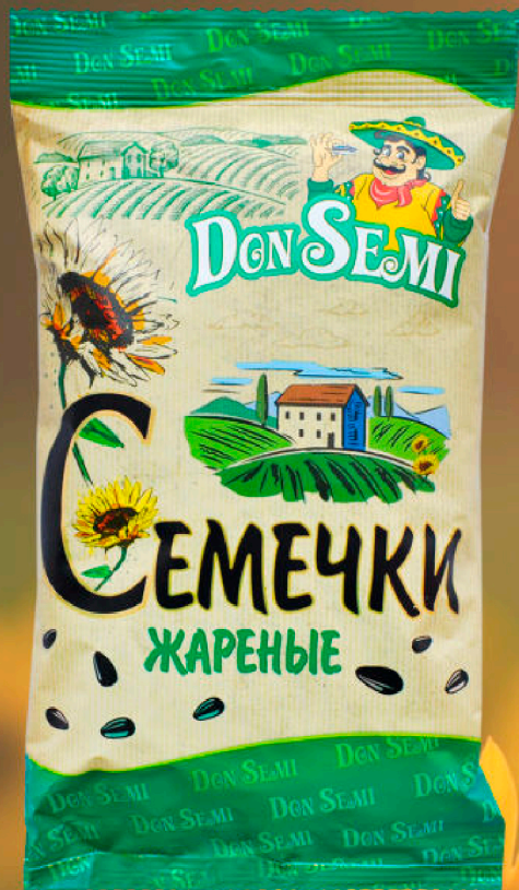
СЕМЕНА ПОДСОЛНЕЧНИКА ЖАРЕННЫЕ 100 Г. В ПАКЕТЕ