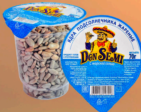
ЯДРА ПОДСОЛНЕЧНИКА ЖАРЕННЫЕ С МОРСКОЙ СОЛЬЮ 70 Г. В ПЛАСТИКОВОМ СТАКАНЕ