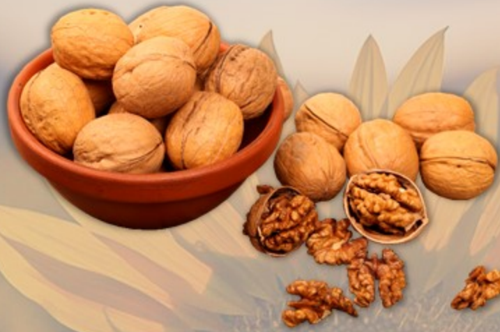
ГРЕЦКИЕ ОРЕХИ В СКОРЛУПЕ