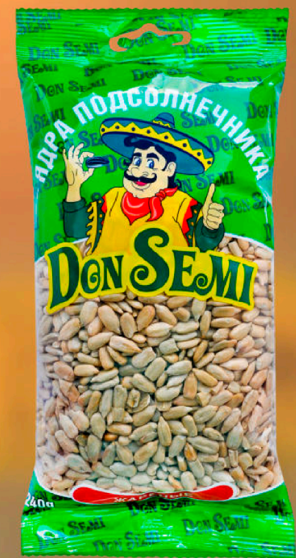
ЯДРА ПОДСОЛНЕЧНИКА ЖАРЕННЫЕ 240 Г. В ПАКЕТЕ