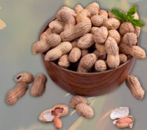
АРАХИС В СКОРЛУПЕ