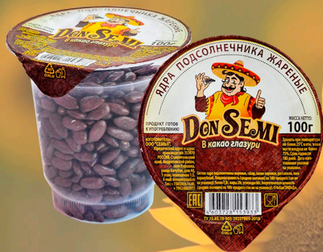
ЯДРА ПОДСОЛНЕЧНИКА В КАКАО ГЛАЗУРИ 100 Г. В ПЛАСТИКОВОМ СТАКАНЕ