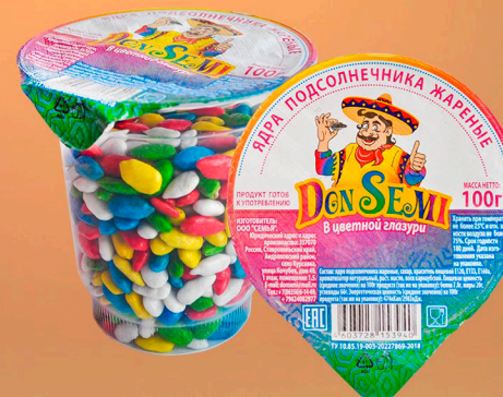
ЯДРА ПОДСОЛНЕЧНИКА В ЦВЕТНОЙ ГЛАЗУРИ 100 Г. В ПЛАСТИКОВОМ СТАКАНЕ