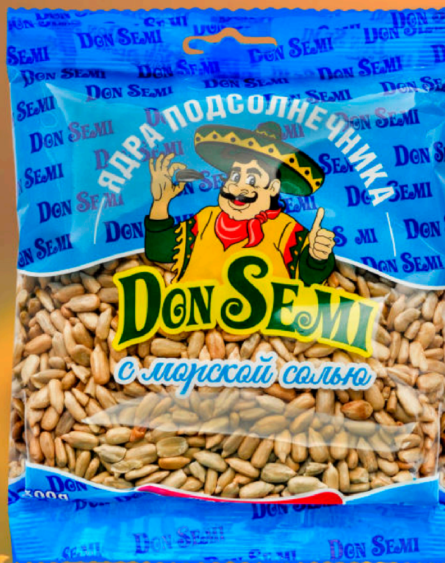
ЯДРА ПОДСОЛНЕЧНИКА ЖАРЕННЫЕ С МОРСКОЙ СОЛЬЮ 300 Г. В ПАКЕТЕ