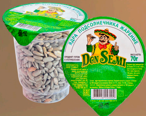
ЯДРА ПОДСОЛНЕЧНИКА ЖАРЕННЫЕ 70 Г. В ПЛАСТИКОВОМ СТАКАНЕ