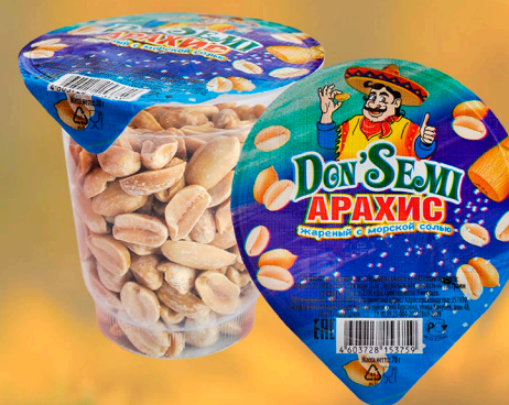
АРАХИС ЖАРЕННЫЙ С МОРСКОЙ СОЛЬЮ 70 Г. В ПЛАСТИКОВОМ СТАКАНЕ