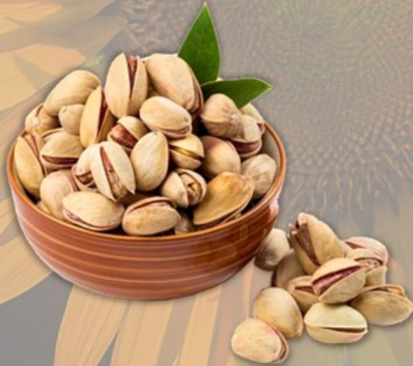
ФИСТАШКИ В СКОРЛУПЕ