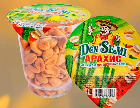
АРАХИС ЖАРЕННЫЙ СО ВКУСОМ МЕКСИКАНСКОЙ СМЕСИ 70 Г. В ПЛАСТИКОВОМ СТАКАНЕ