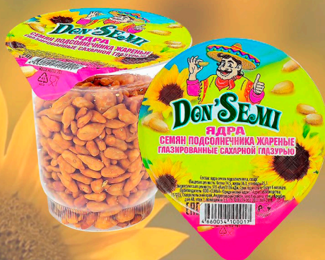
ЯДРА ПОДСОЛНЕЧНИКА ЖАРЕННЫЕ В САХАРЕ 70 Г. В ПЛАСТИКОВОМ СТАКАНЕ